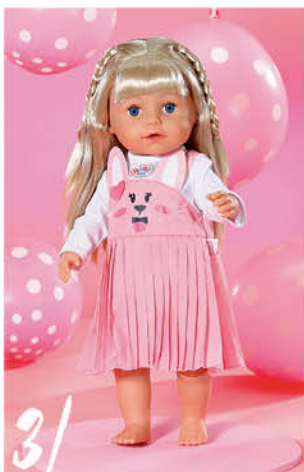
3 | BABY born Šatičky zajíček, 43 cm součástí je ramínko. 832868