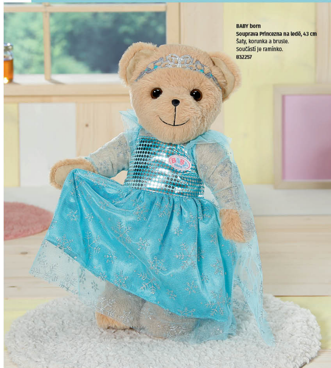
BABY born Souprava Princezna na ledě, 43 cm Šaty, korunka a brusle. Součástí je ramínko. 832257

Medvídci i medvědice BABY born milují ze všeho nejvíc led, a to v jakékoli formě: třeba jahodovou zmrzlinu, nanuky nebo kluziště. Jako opravdová medvědí princezna nosí třpytivé šaty, jejichž horní část vypadá jako by byla ušita z ledových kostek. Modré šatíčky jsou pokryty ledovými krystalky a součástí je i krásná čelenka. Lední medvídek vypadá naprosto neodolatelně, když se po ledě prohání v Soupravě „Princezna na ledě“.