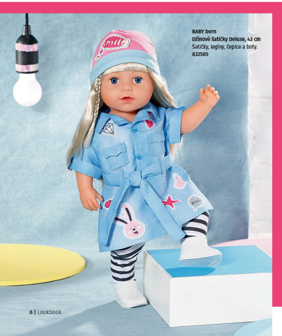
BABY born Džínové šatíčky Deluxe, 43 cm Šatíčky, legíny, čepice a boty. 832585

Jak asi vznikly tyto modely ze seprané džínoviny? Snad se oblečení BABY born opět nepralo v pračce s kamínky v kapsách? Šaty košilového střihu mají ohrnuté rukávy, našité kapsy a pásek na zavazování. Zdobí je hravé potisky, které připomínají nášivky. Sestřička k nim nosí černobílé pruhované legíny, bílé tenisky a růžovou čepičku.