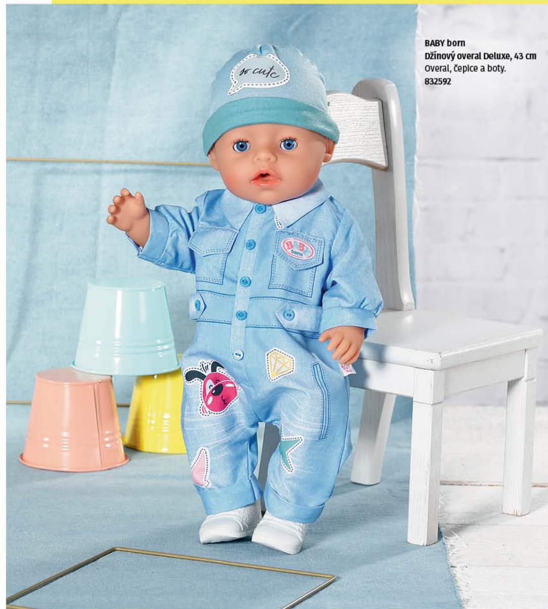
BABY born Džínový overal Deluxe, 43 cm Overal, čepice a boty. 832592

V tomto ležérním overalu zvládne BABY born opravdu cokoli. Overal v džínovém vzhledu má našité kapsy a knoflíky. Kolem krku ho zdobí úhledný límeček. I overal je potištěn motivy, které vypadají jako nášivky. Bílé tenisky tvoří dokonalý kontrast k modrému oblečení. Na hlavě má panenka modrou čepičku s nápisem „so cute“ – anglickým výrazem pro „tak roztomilé“.