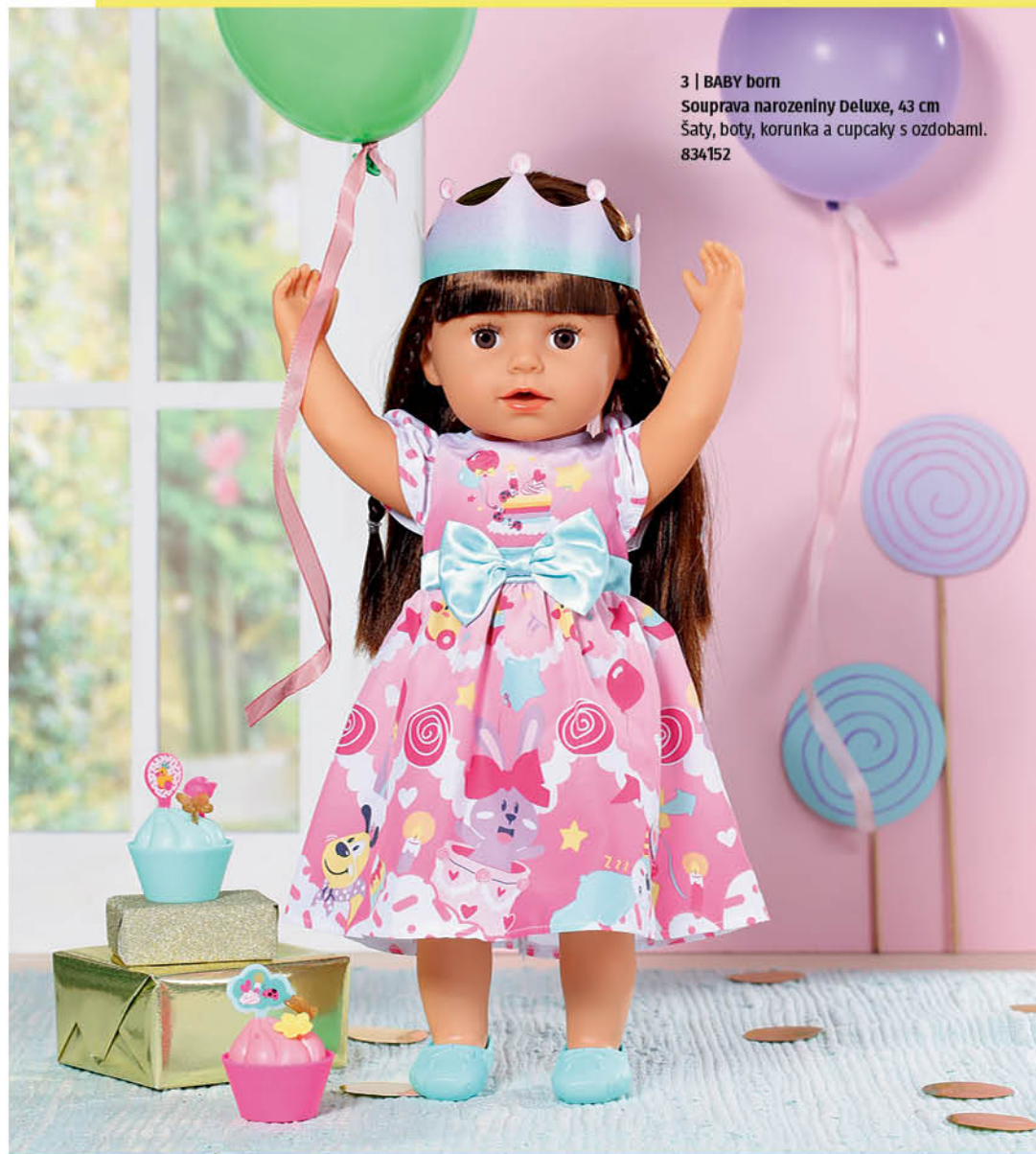
3 | BABY born Souprava narozeniny Deluxe, 43 cm šaty, boty, korunka a cupcaky s ozdobami. 834152

Speciální narozeniny si zaslouží speciální outfit. Kouzelné šatičky s tyrkysovou mašličkou v pase skvěle ladí k balerínkám a BABY born je díky nim nejzářivější hvězdou mezi hosty narozeninové oslavy. Ale hosté již začínají být netrpěliví. Kdepak je narozeninový dort, který BABY born zdobí horní část šatiček? Sada našťastí obsahuje také dva cupcaky s roztomilými ozdobami.