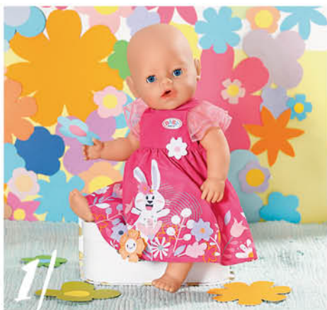
1 | BABY born Šatičky s kytíčkami, 43 cm součástí je ramínko. 832639

Pravidla oblékání BABY born jsou jasná a jednoduchá. Vše musí být roztomilé, hravé a v různých odstínech růžové. Ale hlavně navržené s láskou. Každé šatičky mají jiný tvar sukně. Sukně tmavě růžových šatiček je bohatě nabíraná. Pod sukýnku světle růžových šatiček pejsek Bello schoval spodničku. A když se šily šatičky se zajíčkem, někdo si dal opravdu záležet, aby elegantní záhyby na sukni byly jeden jako druhý. Šaty z růžové krajky milovnice hippies oblečení podtrhla čelenkou s růžovou květinou. Šatičky pro BABY born jsou skutečně jedny hezčí než druhé.