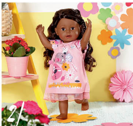
2 | BABY born Šatičky s pejskem, 43 cm součástí je ramínko. 833612