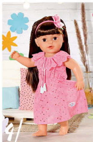
4 | BABY born Květinové šatičky, 43 cm šatičky a čelenka. součástí je ramínko. 832684