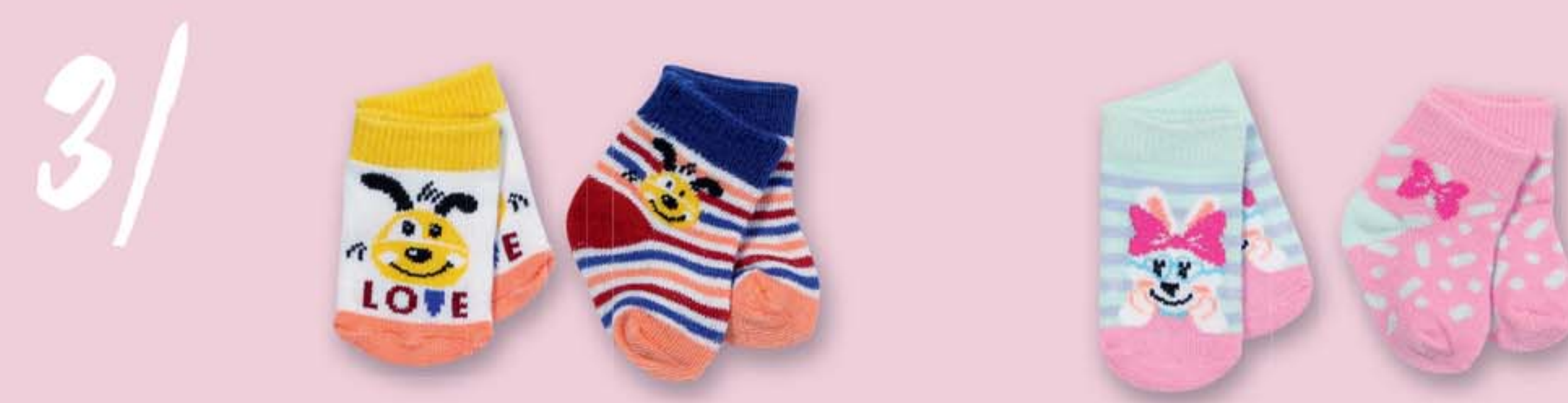
3 | BABY born Ponožky (2 páry), 2 druhy, 43 cm 831755