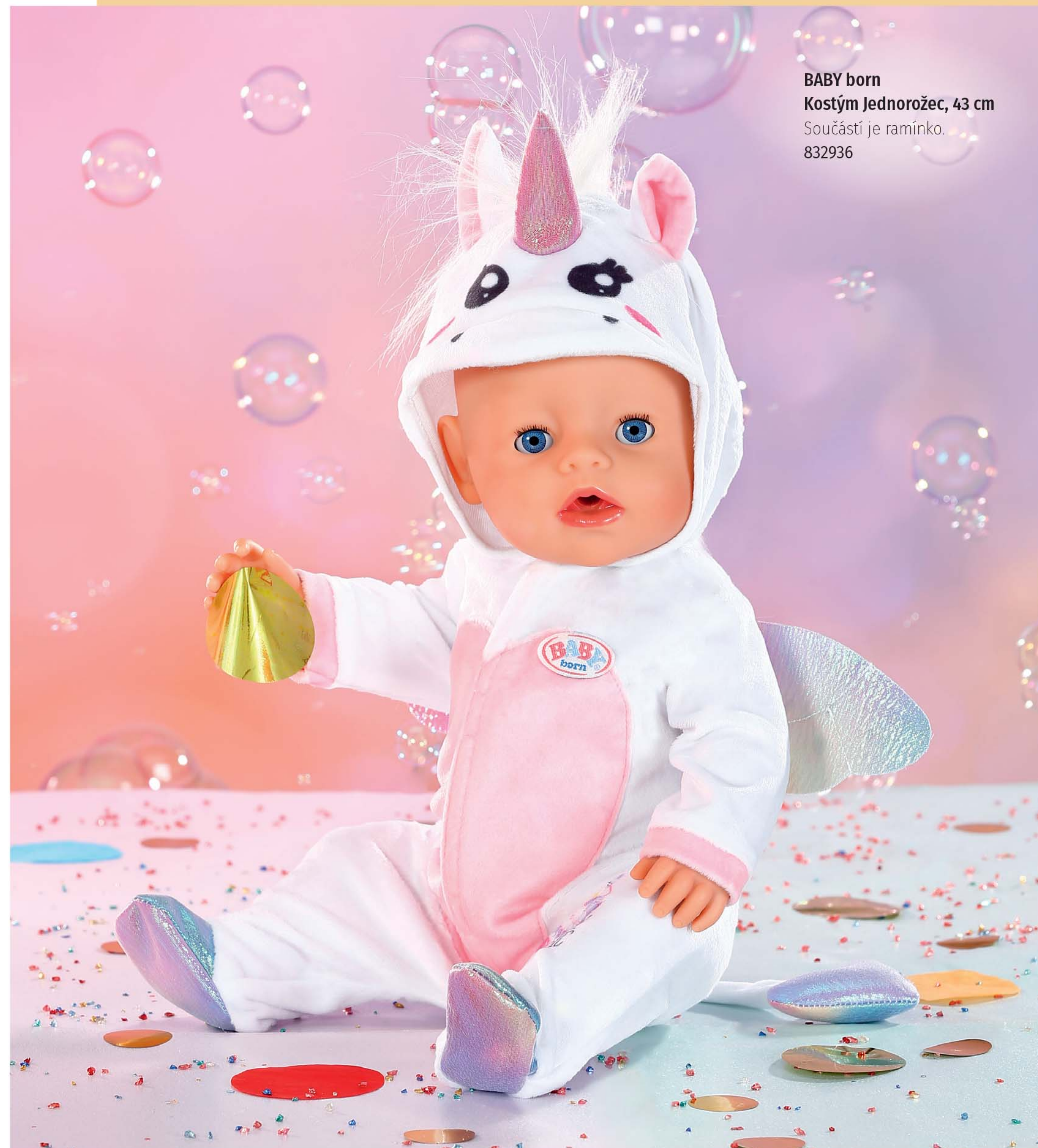
BABY born Kostým Jednorožec, 43 cm Součástí je ramínko. 832936

Overall je název pro jednoduché oblečení. A jakpak se říká tomuto modelu? Jednoduše Kostým Jednorožec. Jednoduché oblečení z měkké duhové látky má kapuci s roztomilými ušky. Na kapuci je připevněn lesklý jednorožčí roh a hříva. Na zádech jsou našita třpytivá křídélka a na zadečku legrační ocásek.