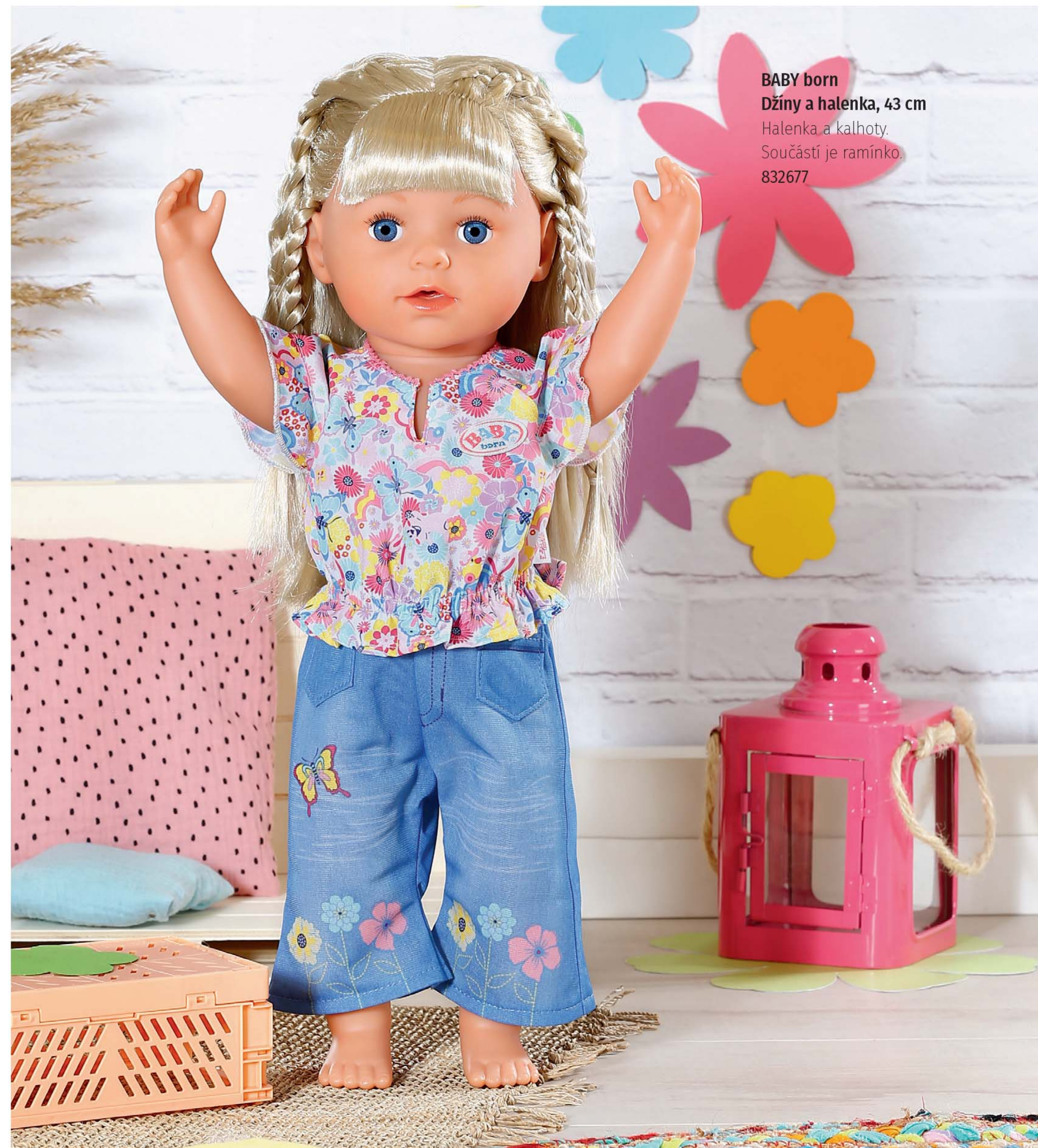
BABY born Džíny a halenka, 43 cm Halenka a kalhoty. Součástí je ramínko. 832677

Květinové nálady všude kolem si nejde nevšimnout. Halenka tohoto módního oblečení je potištěná jemnými kvítky. Má splývavé rukávy a hravé nabírání v pase. Aby byl outfit dokonalý, má na sobě květinová holčička kalhoty v džínovém vzhledu se zvonovými nohavicemi a ozdobnými kapsami. Jsou potištěny rozkošným motýlem a dalšími květinami.