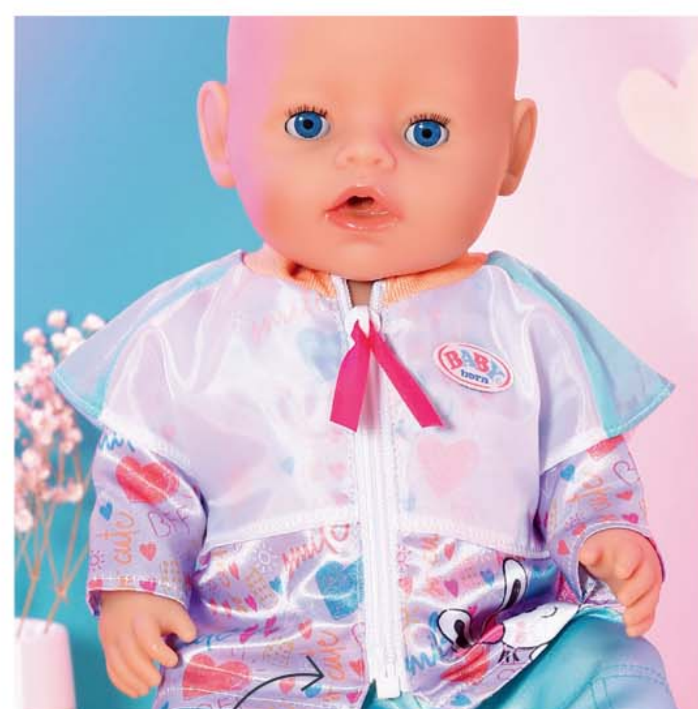
detail se zipem

Svérázná móda 80. let se vrací. BABY born a její starší sestřičky milují křiklavé modely v pronikavých barvách s výstředním designem. Milovnice módy mohou divoce kombinovat. K lesklým tyrkysovým kalhotám nosí třeba vrstvenou bundu s průhledným pláštěm. Starší sestřičce brunetce velmi sluší větrovka a mrkváče s výrazným potiskem.