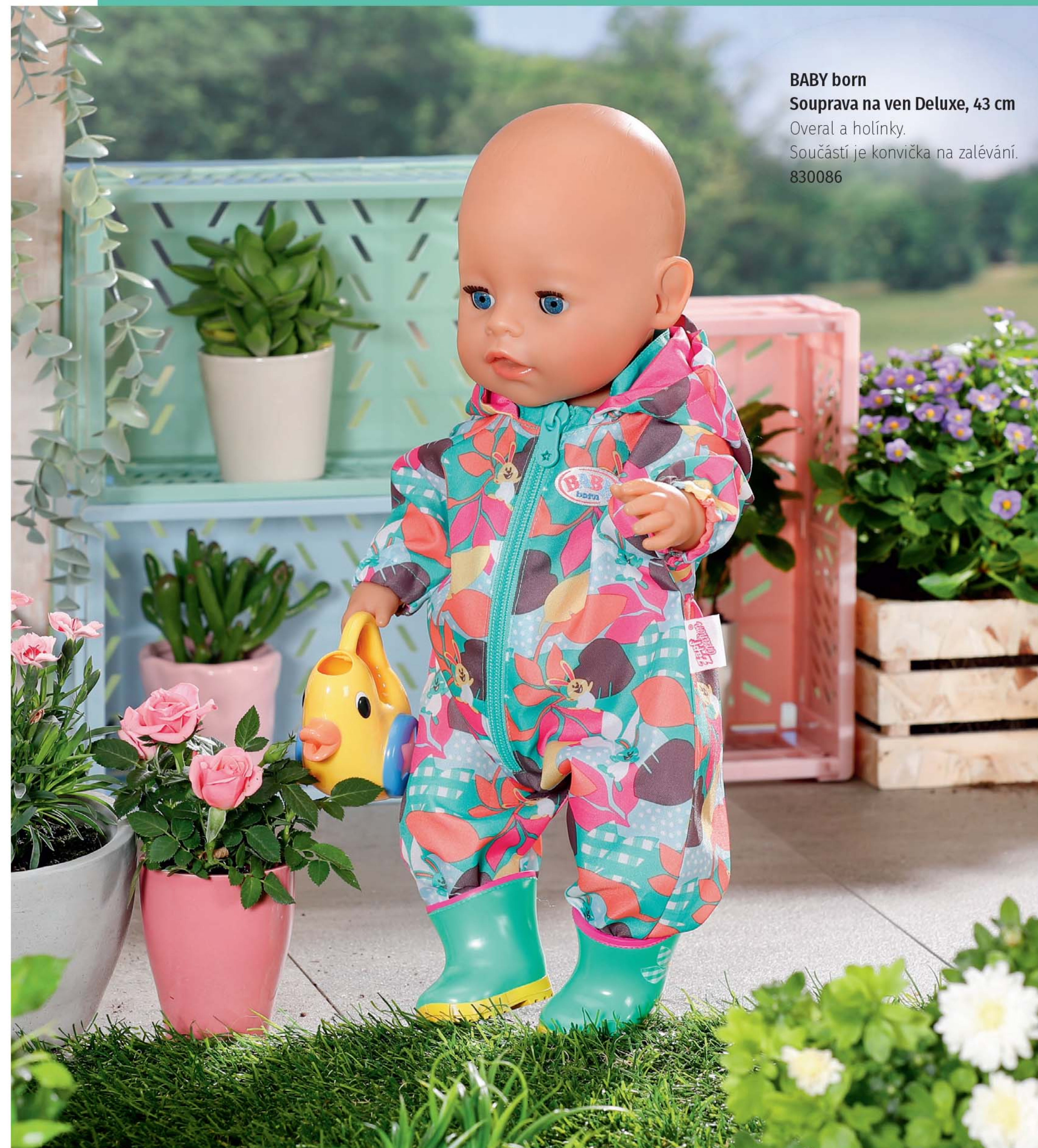
BABY born Souprava na ven Deluxe, 43 cm Overall a holínky. Součástí je konvička na zalévání. 830086

Holínky jsou užitečné i při práci na zahradě. Když BABY born chodí s konvičkou ve tvaru kačeny od květináče ke květináči a zalévá, zůstanou jí nožičky vždy hezky v suchu. Na zahradničení si malá zahradnice oblékla overall s kapucí. Tyrkysová kombinéza vypadá, jako by se na ni sneslo barevné listí ze všech stromů. Vpředu má zip pro snadné oblékání.