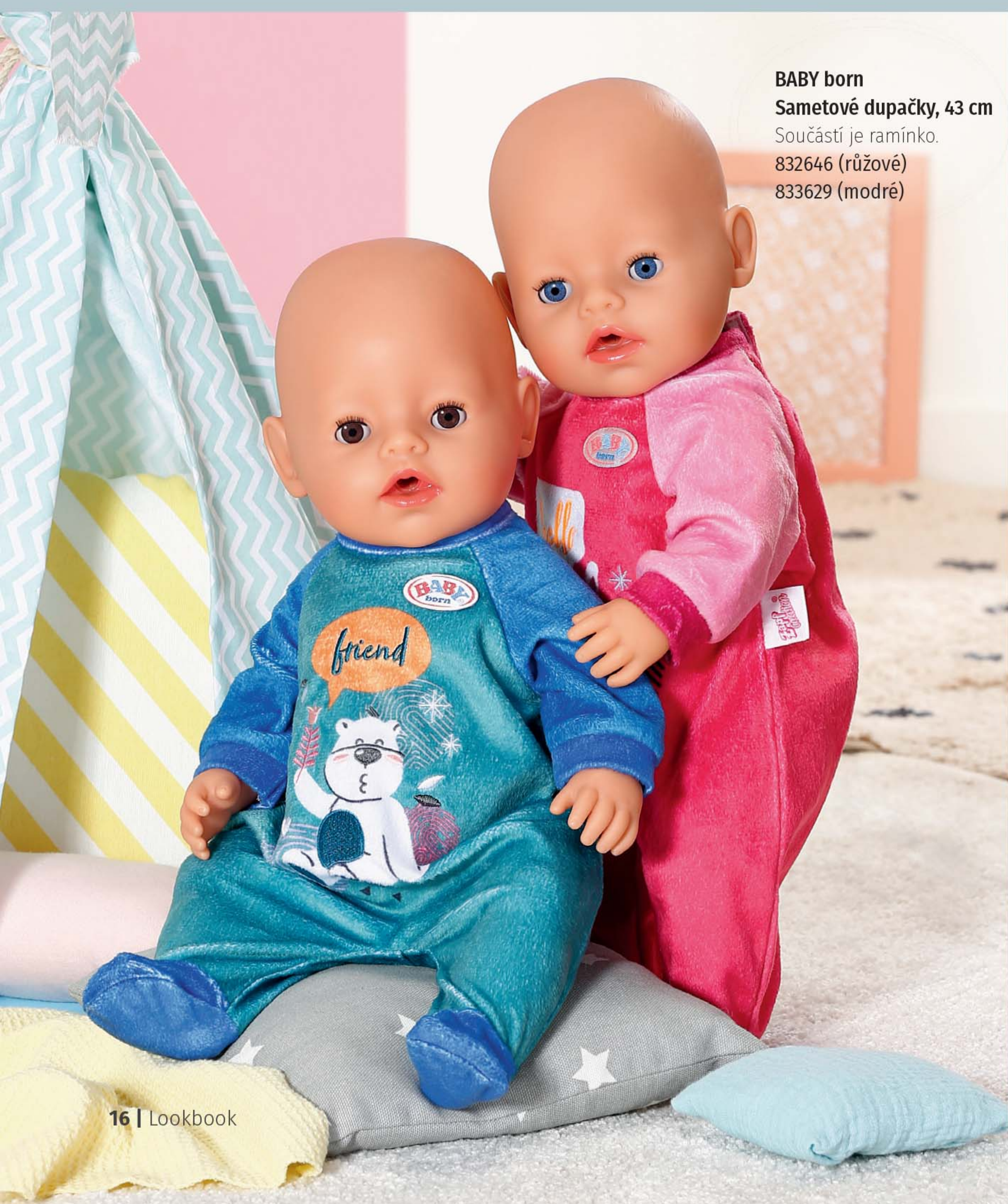
BABY born Sametové dupačky, 43 cm Součástí je ramínko. 832646 (růžové) 833629 (modré)

BABY born, chce se ti bláznivě skákat, stejně jako skotačí zajíček Benno na růžovém overalu, nebo si chceš raději odpočinout jako medvídek Bruno na modrém modelu? Ale je to vlastně jedno. Oba overaly totiž poskytují dostatek volnosti pro pohyb při bouřlivých polštářových bitvách a zároveň jsou velmi pohodlné pro dlouhé hodiny mazlení. První z overalů je ušitý v různých odstínech růžové barvy, které připomínají ostružinovou, jahodovou a třešňovou zmrzlinu. Druhý overal září v tyrkysové a azurově modré barvě.