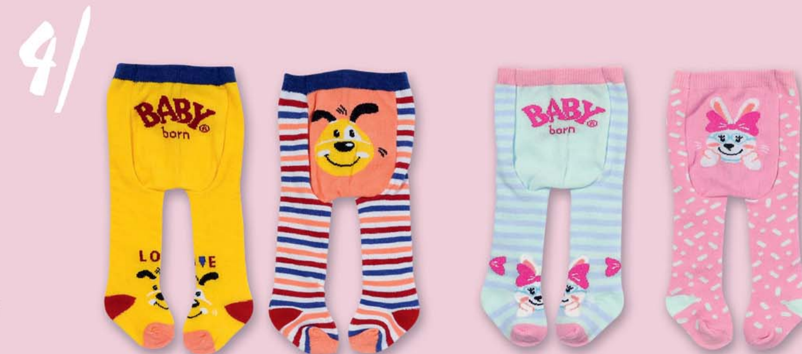
4 | BABY born Punčocháče (2 ks), 2 druhy, 43 cm 831748