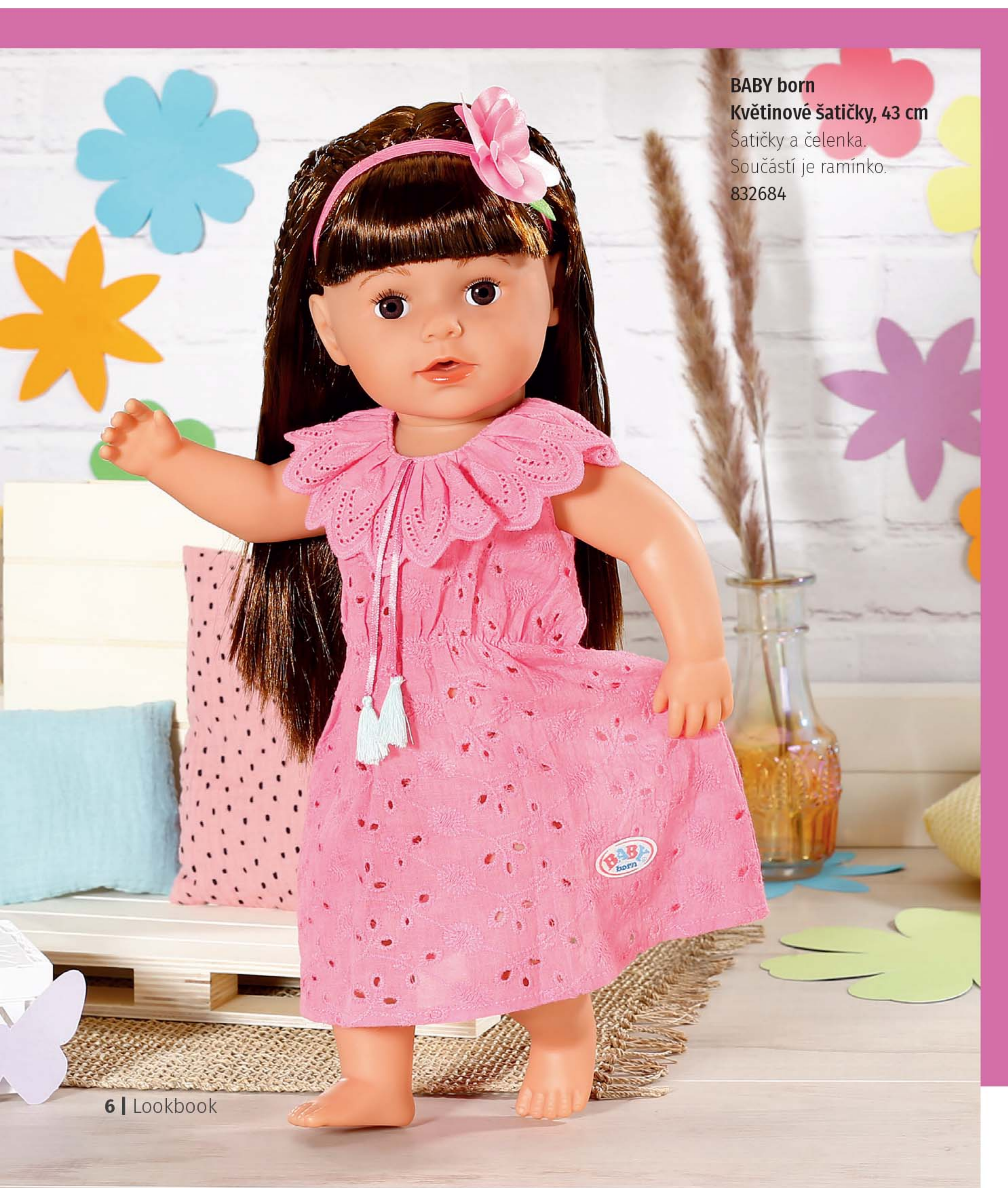
BABY born Květinové šatičky, 43 cm Šatičky a čelenka. Součástí je ramínko. 832684

Květinové děti milují módní - jak jinak než květinový - styl. Snoubí se v něm jednoduchá ležérnost se zasněnou elegancí. Trochu retro, trochu vintage a výsledkem je špičkový model. Šaty z růžové krajky jsou ozdobeny volánovým límcem, ze kterého visí růžové stužky s hravými střípci na koncích. Celý vzhled milovnice hippies oblečení podtrhla čelenkou s květinou.