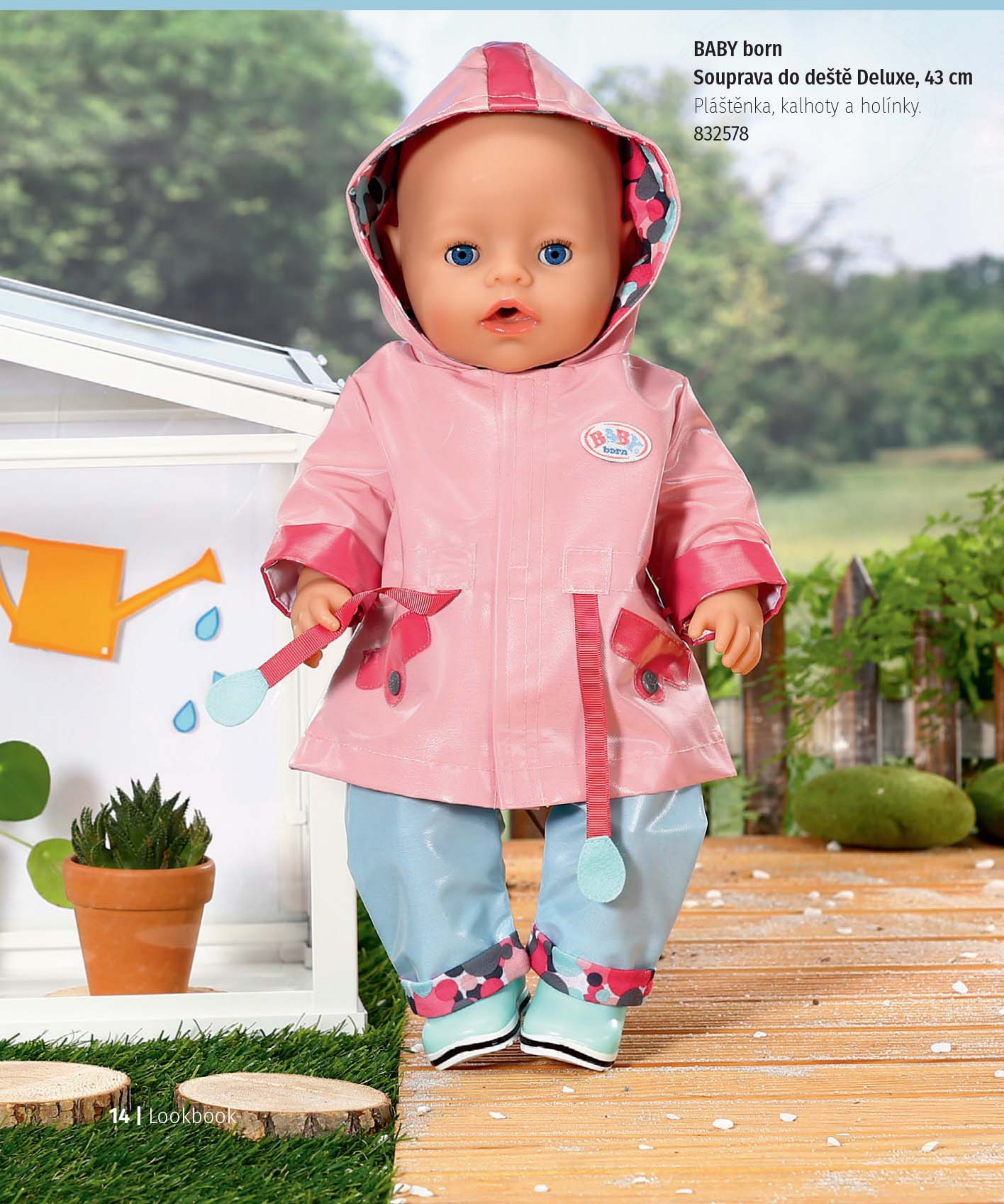
BABY born Souprava do deště Deluxe, 43 cm Pláštěnka, kalhoty a holínky. 832578

BABY born je milovnice všech venkovních aktivit. Malá dešťová víla si čas strávený na zahradě vždycky užívá – ať už prší nebo svítí sluníčko. Má totiž správné funkční oblečení do každého počasí. Růžová pláštěnka je na zádech ozdobena legračním potiskem. Pod pláštěnku si BABY born oblékla modré nepromokavé kalhoty s kšandami. Oblečení do deště a holínky ji udrží pěkně v suchu, dokud se neukáže duha.