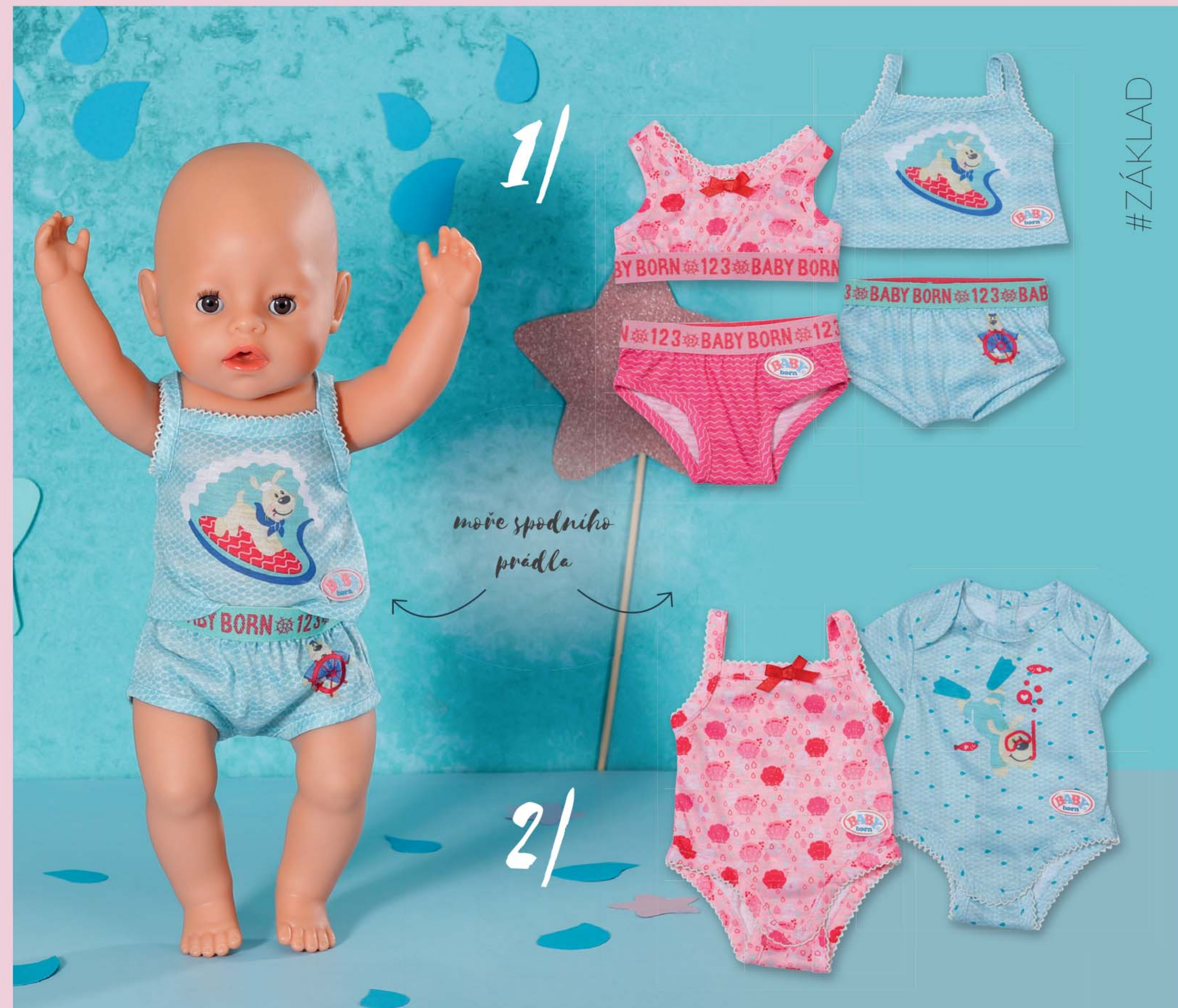
1 | BABY born Spodní prádlo, 2 druhy, 43 cm Součástí je ramínko. 830123